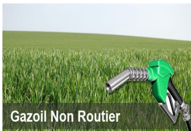
Gazoil Non Routier

Un produit stable (pas de limite dans le temps)